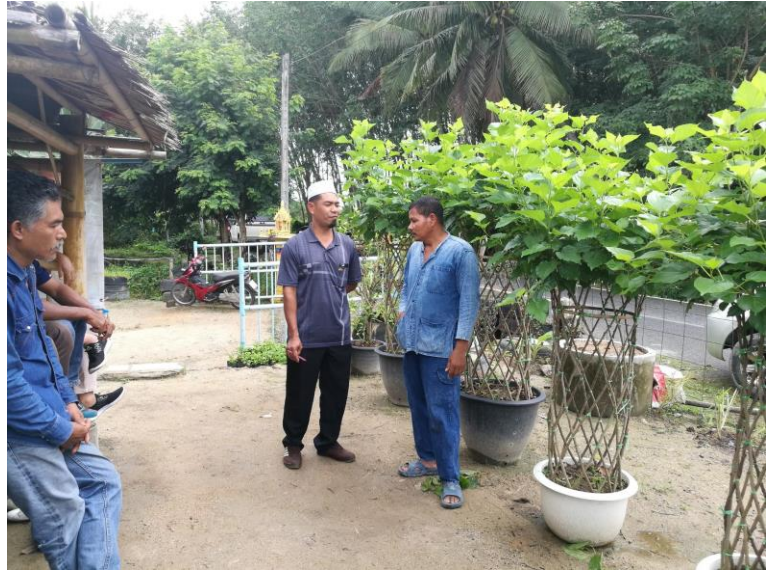
๕. ฐานปลูกหม่อนหรือมัลเบอร์รี่