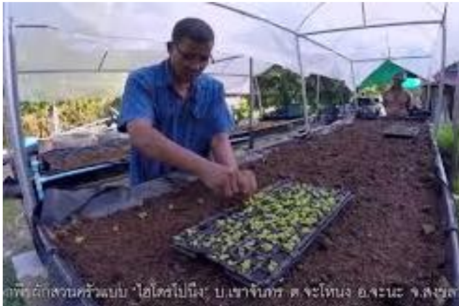
๑. ปลุกพืชแบบไฮโดรโปรนิง