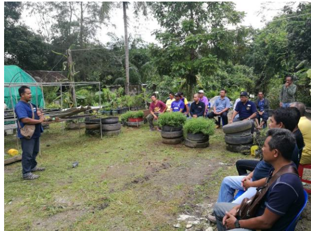
๖. ฐานเรียนรู้เศรษฐกิจพอเพียง