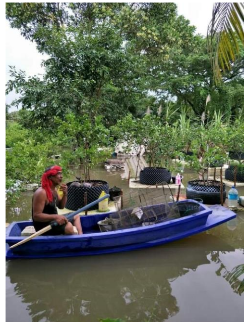
๔. การปลูกมะนาวลอยน้ำ (ฐานเรียนรู้เกษตรกรเครือข่าย)