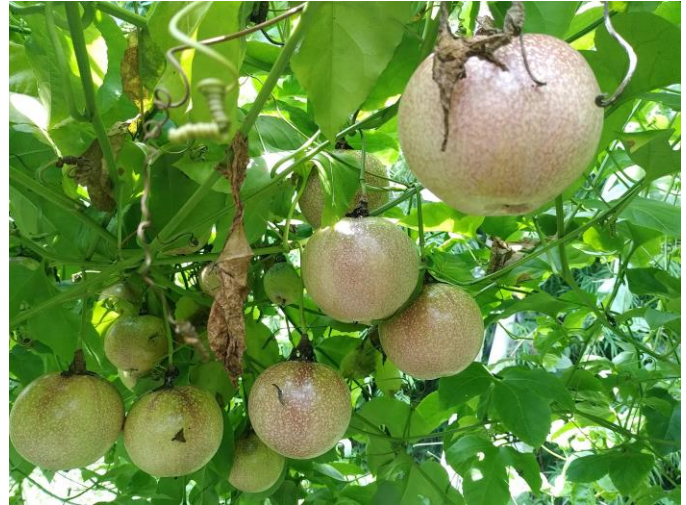
๓. การปลูกพืชเสาวรส