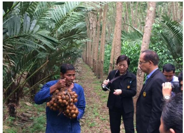
๒. การปลูกพืชแซมยาง