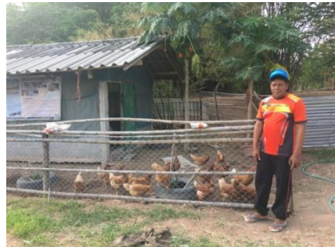
การเกษตรตามหลักเศรษฐกิจพอเพียง