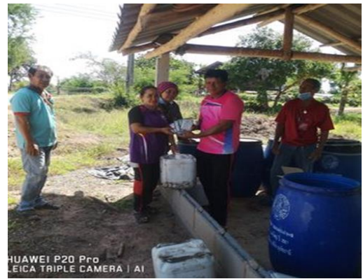
การปรับปรุงบำรุงดิน