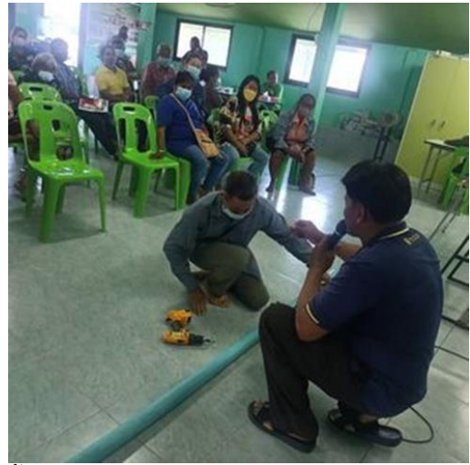
การวางระบบน้ำหยด